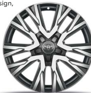
18-Zoll-Leichtmetallfelge, im 10-Doppelspeichen-Design, in Silber glänzend