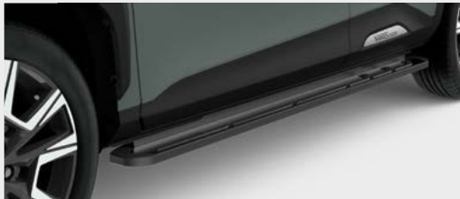
Trittbrett aus Aluminium

Dachboxen in verschiedenen Ausführungen mit einem Volumen von 415–512 Litern.