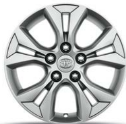
16-Zoll-Leichtmetallfelge, im 5-Doppelspeichen-Design, in Silber