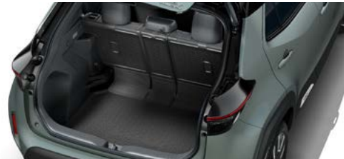
Kofferraumschalenmatte und Rückbankverkleidung