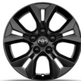
16-Zoll-Leichtmetallfelge, im 5-Doppelspeichen-Design, in Schwarz glänzend