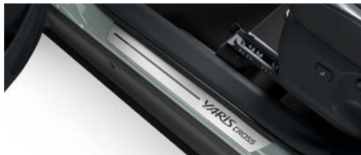
Einstiegsleisten, Schriftzug „Yaris Cross“