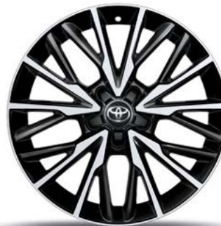
18-Zoll-Leichtmetallfelge, im 10-Doppelspeichen-Design