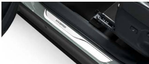
Einstiegsleisten, Schriftzug „Hybrid“