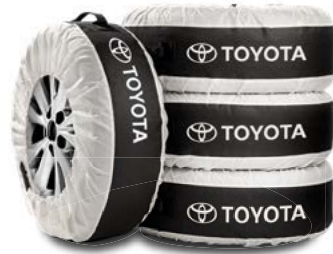
Reifensäcke mit Toyota Schriftzug