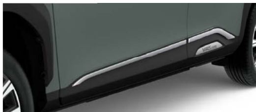
Seiten-Zierleisten aus Kunststoff, verchromt