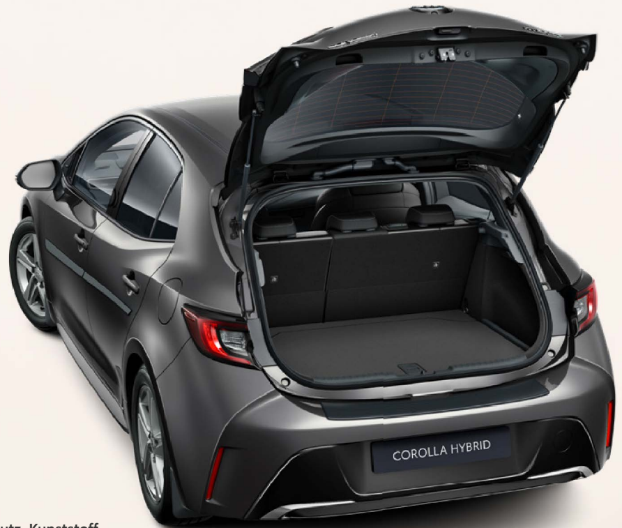
Ladekantenschutz, Kunststoff (5-Türer)

Design, Komfort und Sicherheit: Ihr Corolla glänzt bereits durch unvergleichliche Qualitäten. Dank Toyota Original-Zubehör Ihres Toyota Partners können Sie Ihren Corolla noch weiter perfektionieren, bis er Ihren Wünschen und Bedürfnissen exakt entspricht.