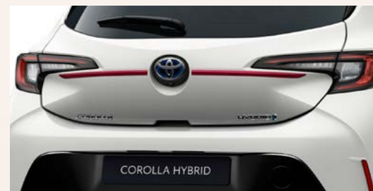
Obere Heckklappen-Zierleiste (5-Türer)