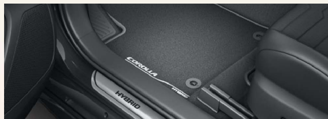
Fußmatten aus Velours