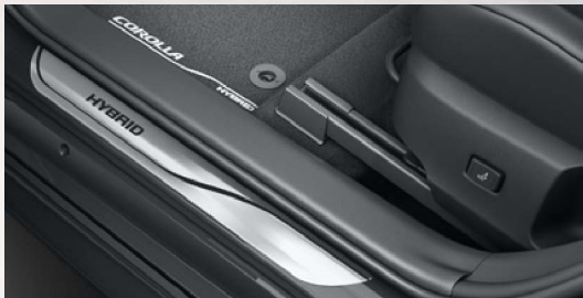
Einstiegsleisten Aluminium, vorne und hinten