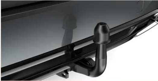
Anhängerzugvorrichtung (Corolla Touring Sports)