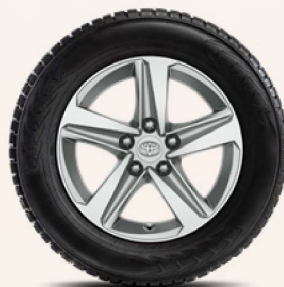
16-Zoll-Winterkomplettrad, silbern oder schwarz