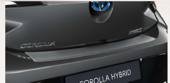
Ladekantenschutz, Edelstahl (5-Türer)