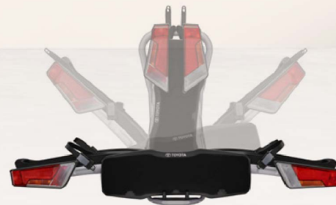
Thule Heckfahrradträger, faltbar