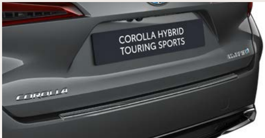
Ladekantenschutz, Edelstahl (Corolla Touring Sports)