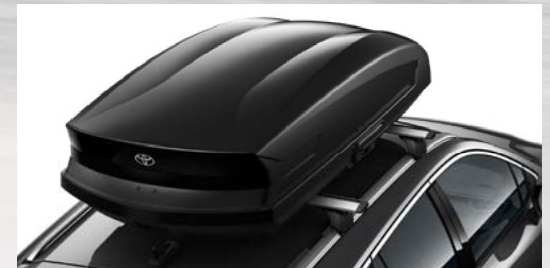
Dachbox mit Querträger (Corolla Touring Sports)