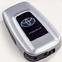
Smart Key Cover Mit Hybrid-Schriftzug