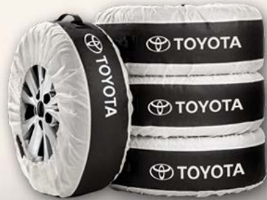
Reifensäcke Mit Toyota Schriftzug