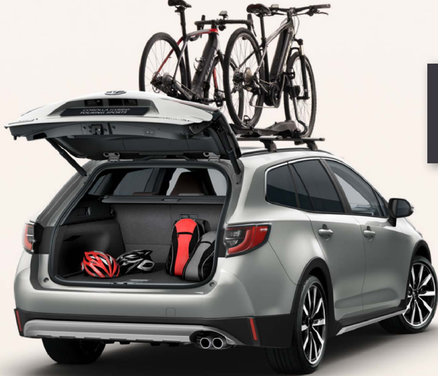
Fahrradträger ProRide (Abbildung ähnlich)

Weitere Informationen zu unserem TOYOTA ORIGINAL ZUBEHÖR finden Sie in unseren Preislisten oder auf toyota.de . Einfach den QR-Code scannen und Topangebote entdecken.