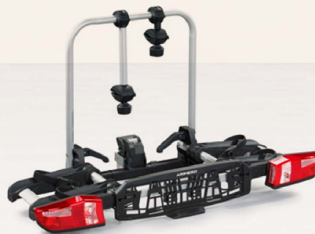
Heckfahrradträger Arimero 402 Geeignet für zwei Fahrräder