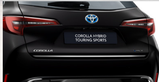
Untere-Heckklappen-Zierleiste, verchromt (Corolla Touring Sports)