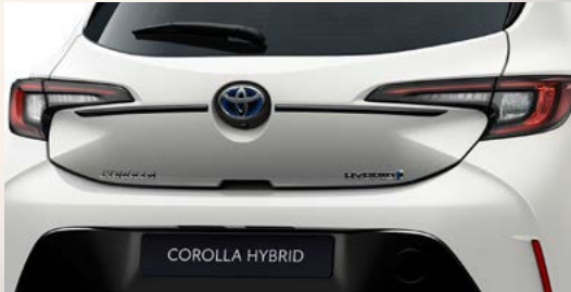
Obere Heckklappen-Zierleiste, verchromt (5-Türer)