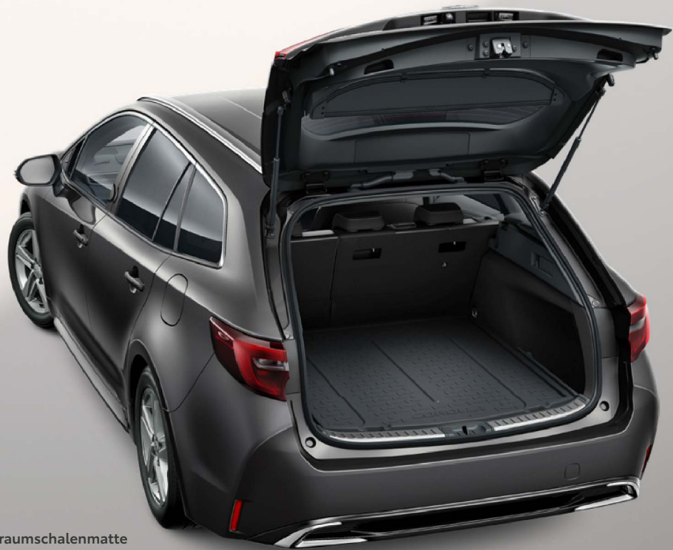
Kofferraumschalenmatte (Corolla Touring Sports)