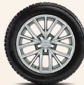
17-Zoll-Winterkomplettrad, silbern oder schwarz