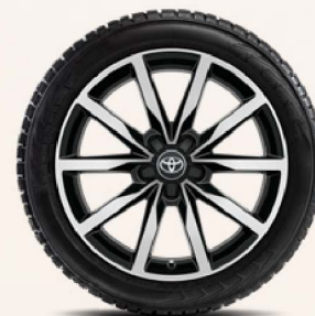
18-Zoll-Winterkomplettrad, schwarz frontpoliert