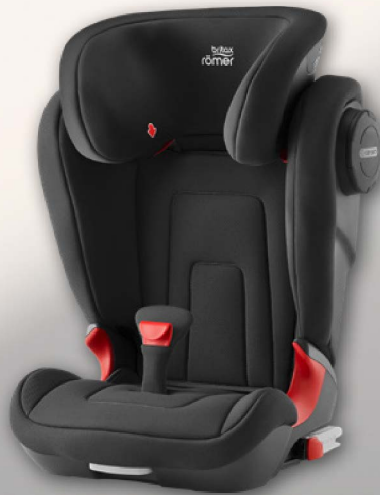
Kindersitz (Abbildung ähnlich)